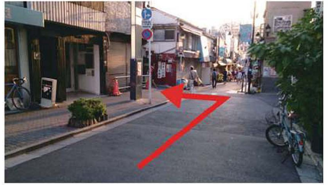
2 夕やけだんだんを下り、「谷中ぎんざ」の大きな看板をくぐってすぐ左に曲がります。