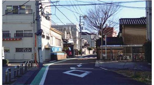
6 電柱に看板が見えてきます。左側が防災広場、右手が空き地があるところの細い路地を入ります。