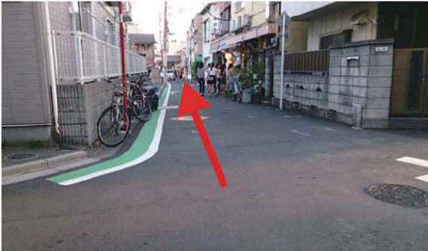
3 右手にかき氷専門店「ひみつ堂」が見えます。そのまま真っすぐ進みます。