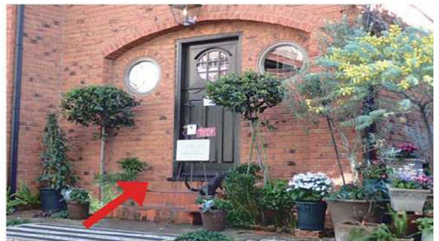
8 アトリエにいますので看板についているインターホンを押してください。(現在、予約制のため左手入り口のインターホンを押してください)