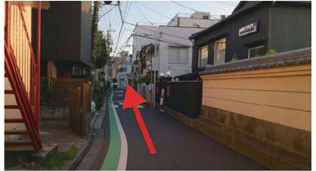
4 右手にカフェ「HAGISO」があり、そのまま真っすぐ進みます。