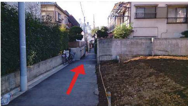
7 路地に入って20m程進むとボタンギャラリーがあります。